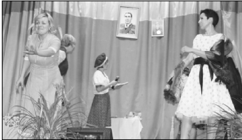
На сцене - инсценировка «Девчат»