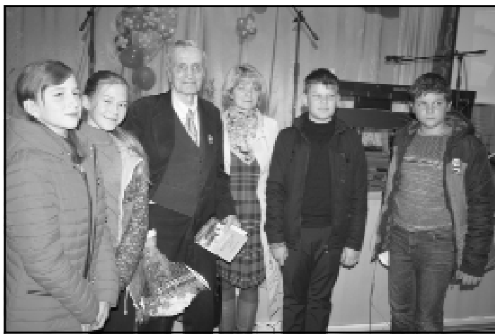
Школьники рады сфотографироваться с поэтом