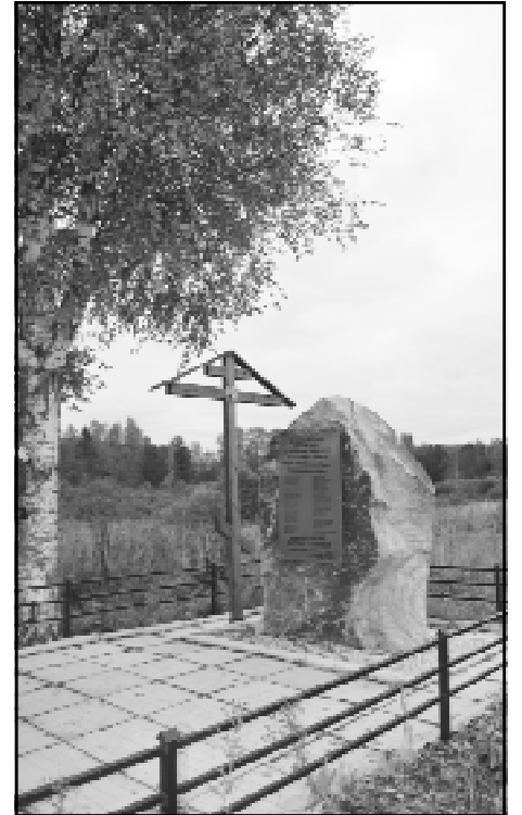
Памятник заживо сожженным жителям деревни Погорельцы

мецко-фашистской оккупации. Я видел то, что невозможно передать словами.