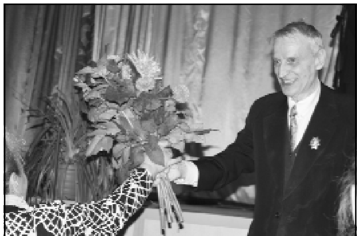
Цветы поэту от всего сердца